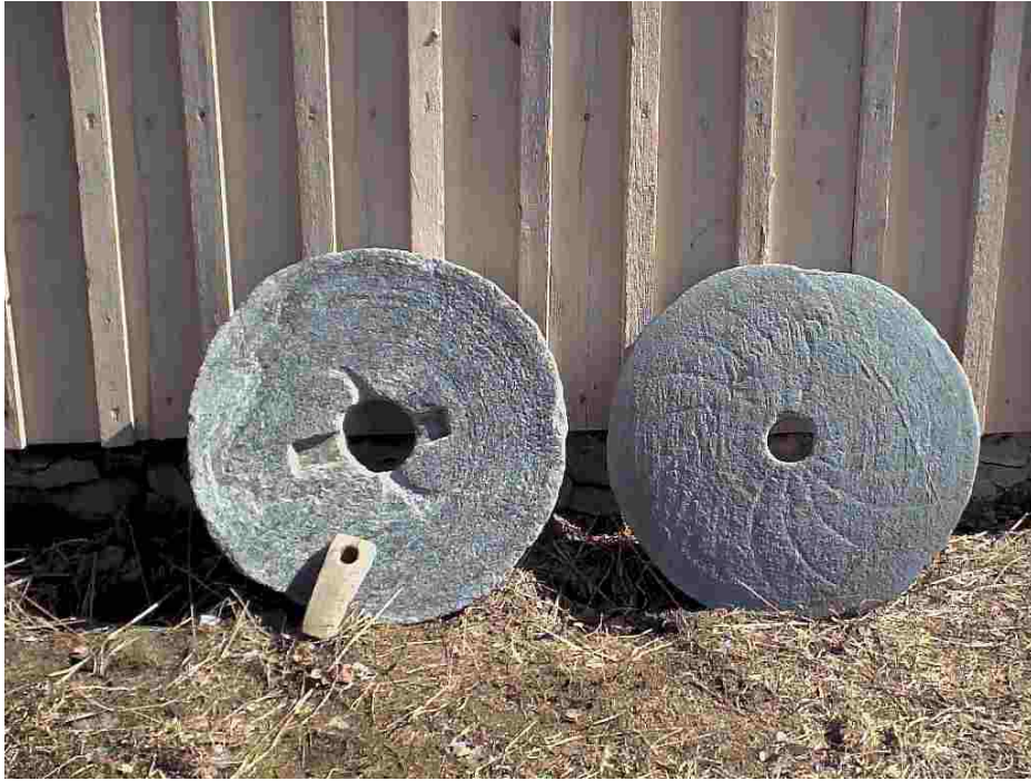
Der Tauschhandel bewegt weniger Waren