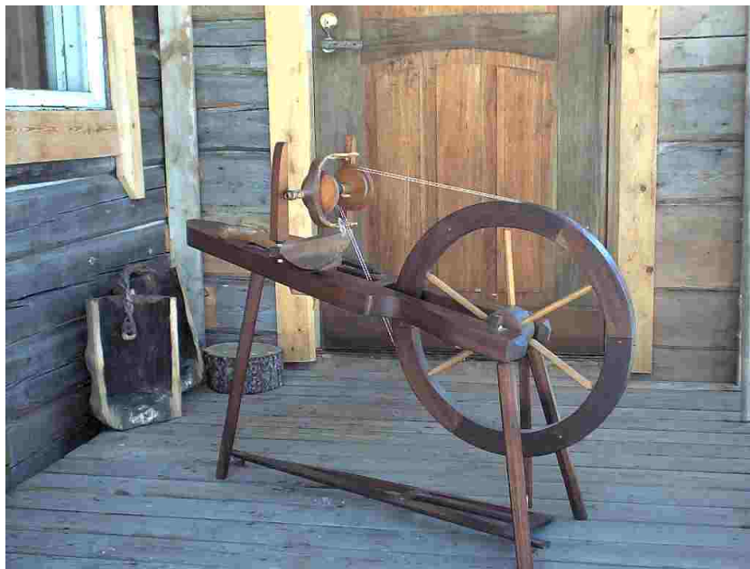
Dieses Spinnrad funktioniert ohne Metall

Es ist auch aus einem weiteren Grund unmöglich, den exakten Energieeinsatz in der Herstellung von Geräten zu errechnen. Wenn wir die einzelnen Energieaufwendungen in der Produktionskette zurückverfolgen, kommen wir in die Situation, daß eine Maschine Teile für verschiedene Produkte herstellt. Die Aufgliederung der Energieeinsätze je Produkt wird auf diese Weise unmöglich. Die Hersteller von sogenannten Energiesparlampen lassen bei ihren Effizienzberechnungen außer Acht, was diese Lampen an zusätzlichem Entsorgungsaufwand fordern im Vergleich zur traditionellen Glühlampe. Auch bedarf die Energiesparlampe einer längeren Produktionskette, die damit Energie fordert. Unsere heutigen Energiesparer sind in Wirklichkeit größere verdeckte Energieschlucker als ihre alten Vorgänger. Wirkliche Effizienz erreichen nur technisch simple Werkzeuge in der Grundproduktion, wie zum Beispiel das Spinnrad oder der (Holz-)Spaten. Je weniger Metall, desto besser.