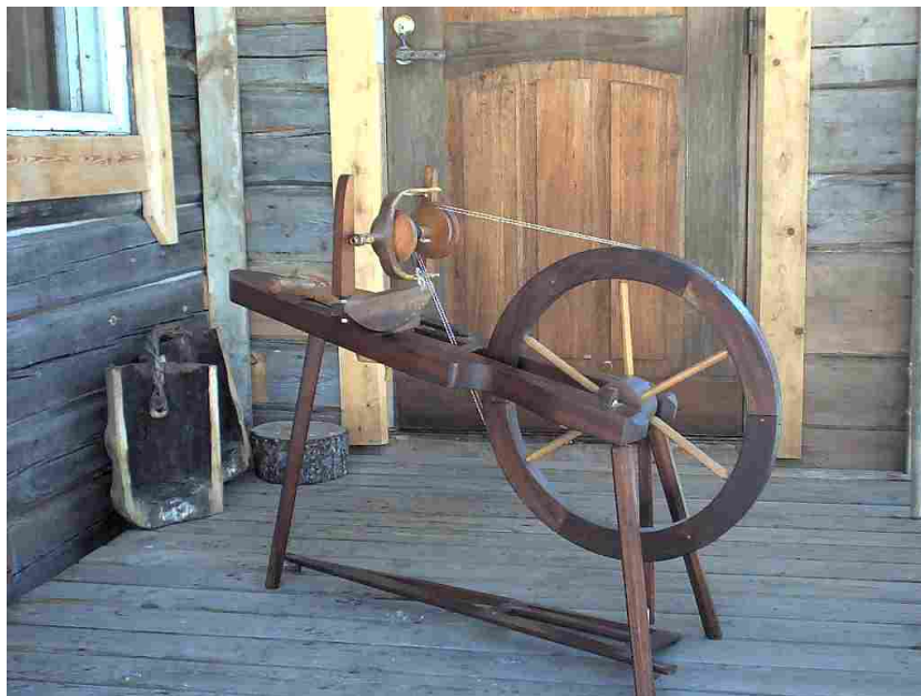
Это веретено работает без металлических частей

По следующей причине невозможно вычислить точные затраты энергии в производстве приборов. Если мы рассмотрим в отдельности энергетические затраты в производственной цепи, то мы столкнёмся с фактом, что одна машина производит детали для различных продуктов. Распределение расходов энергии на каждый продукт будет таким образом невозможным. Производители так называемых энергосберегающих ламп в своих расчётах эффективности оставляют без внимания то, какие дополнительные энергетические затраты последуют при утилизации по сравнению с традиционной лампой накаливания. К тому же энергосберегающая лампа нуждается в более сложном процессе производства, на который тоже необходимы затраты энергии. Наши современные экономщики энергии на самом деле скрытые расточители энергии, более чем их предшественники. Настоящей эффективности достигают лишь технически примитивные устройства в основном производстве, как например веретено или (деревянная) лопата. Чем меньше металла – тем лучше.