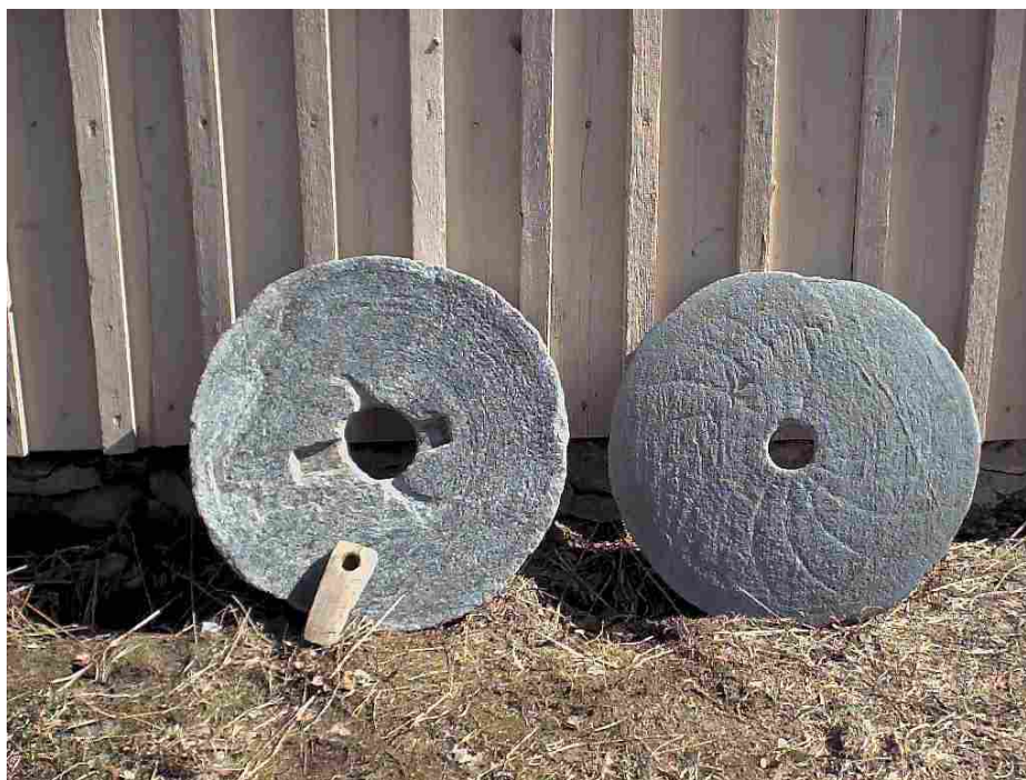
Товарообмен передвигает меньше товаров

Не существует никакой другой энергоэффективной и честной (fair) торговли кроме безденежного товарообмена на близких расстояниях. Альтернатива био-топлива приглашает нас провести мысленный эксперимент: выглядит ли целесообразным, с помощью трактора возделывать рапс, его потом перерабатывать в топливо, заливать его обратно в бензобак, а потом этим трактором обрабатывать картофельные поля? Как человек, занимавшийся проблематикой энергетических балансов, я советую вместо трактора взять тяпку в руки. Таким образом мы бы создали условия, в которых мы бы больше энергии собрали с поля, чем мы затрачиваем на то чтобы собрать картошку.